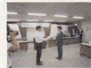
アドバイザー認定式 (8/18 第一生命)

また、株式会社ダスキンでは、統一キャッチフレーズ「オレは誰? STOP! 特殊詐欺」のデザインを取り入れたマットを制作し、銀行やコンビニエンスストア等に提案することとしています。