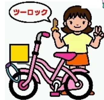
特に外出先ではツーロック

一宮市内では、住宅を狙った侵入盗が多発し、自転車も相変わらず盗まれている状況です。特に空き巣は、昼間から夕方にかけて発生し、無施錠の窓やガラスを割られて侵入されています。また自転車については、駅前の駐輪場より、自宅やマンション、お店の前などに無施錠で置いてある自転車が盗まれています。